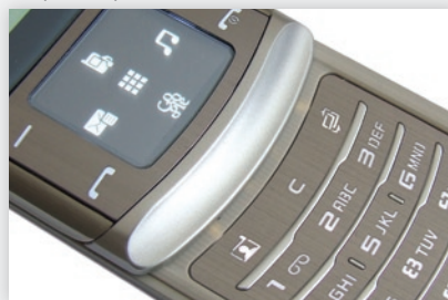
Dotyková plocha a klávesnica