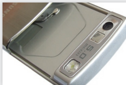
5 Mpx fotoaparát